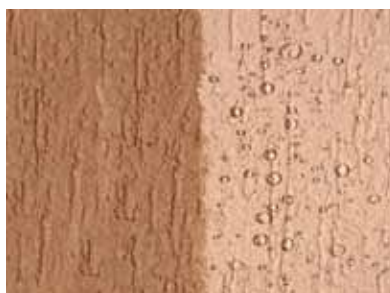
Sin tratamiento. Tratado con HS1.

PENETRA EN PROFUNDIDAD HIDROFUGANDO Y REPELIENDO EL AGUA DE LLUVIA, PERMITIENDO A SU VEZ RESPIRAR A LA SUPERFICIE TRATADA. NO MODIFICA EL ASPECTO ORIGINAL DEL SUSTRATO.